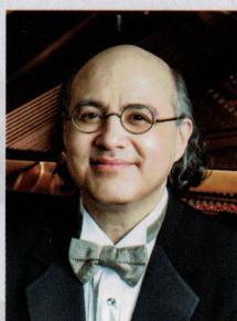
ラファエル・ゲーラ (ピアノ)