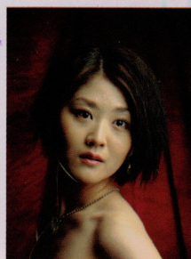
宮川千穂 (メゾソプラノ)